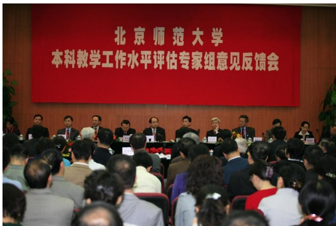
➤ 4月14日—18日 教育部专家组对我校本科教学工作水平进行评估, 图为意见反馈会现场