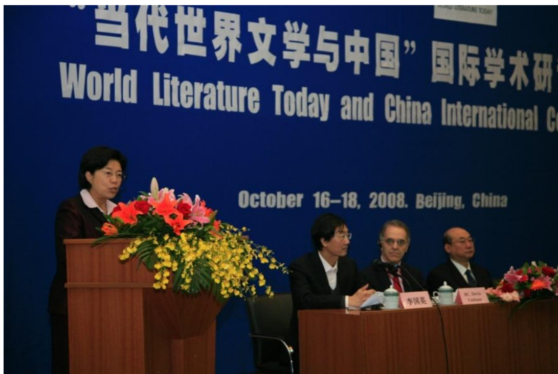
➤ 10月16日“当代世界文学与中国”国际学术研讨会在我校开幕