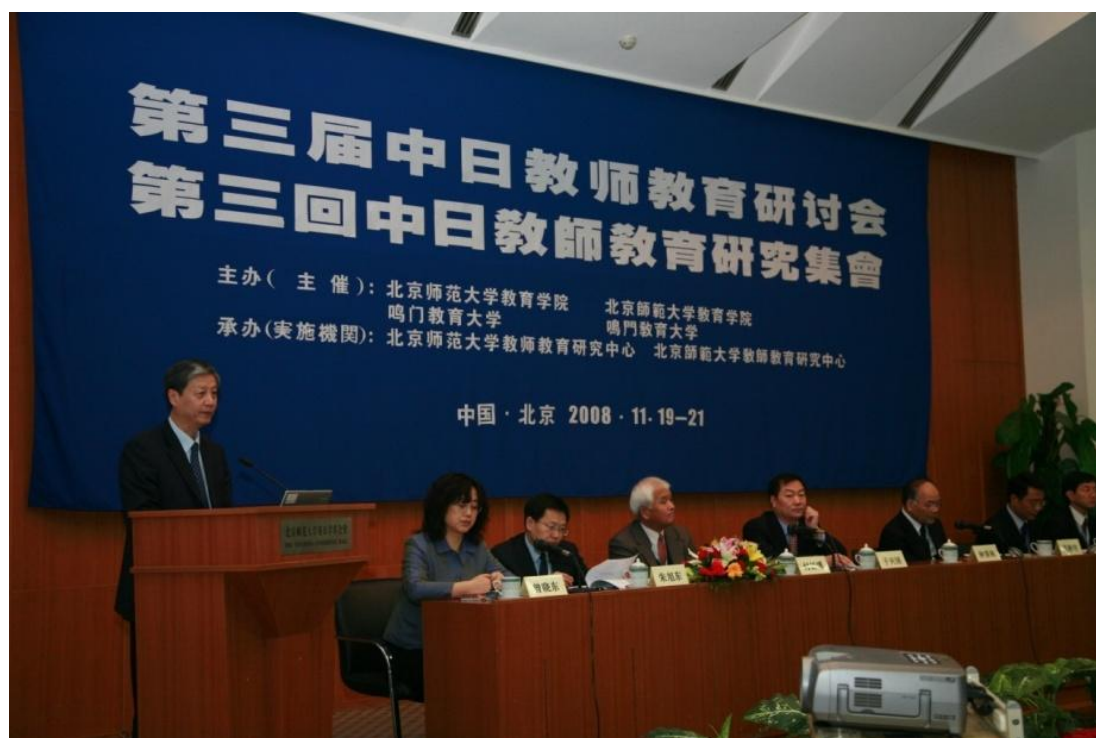
➤ 11月19日 我校教育学院与日本鸣门大学合办“第三届中日教师教育研讨会”