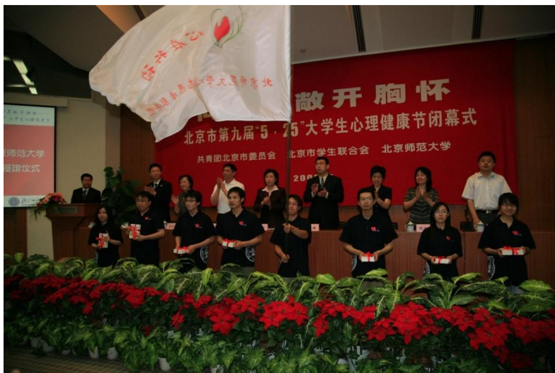
➤ 5月25日 第九届5·25大学生心理健康节闭幕