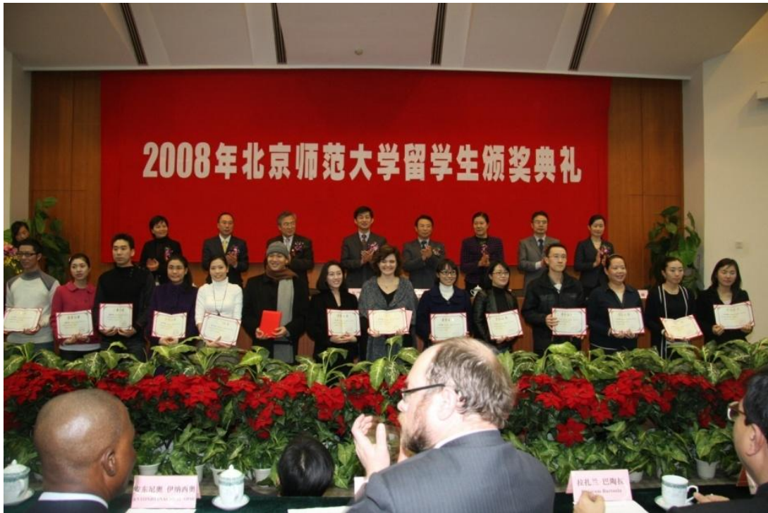
➤ 12月23日 2008年北师大留学生颁奖典礼在英东学术会堂举行