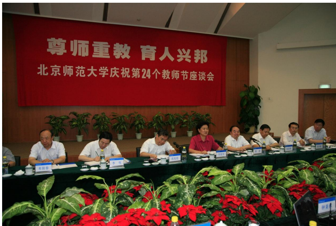
➤ 9月10日 国务委员刘延东来校与师生共度教师节并与我校师生代表座谈。