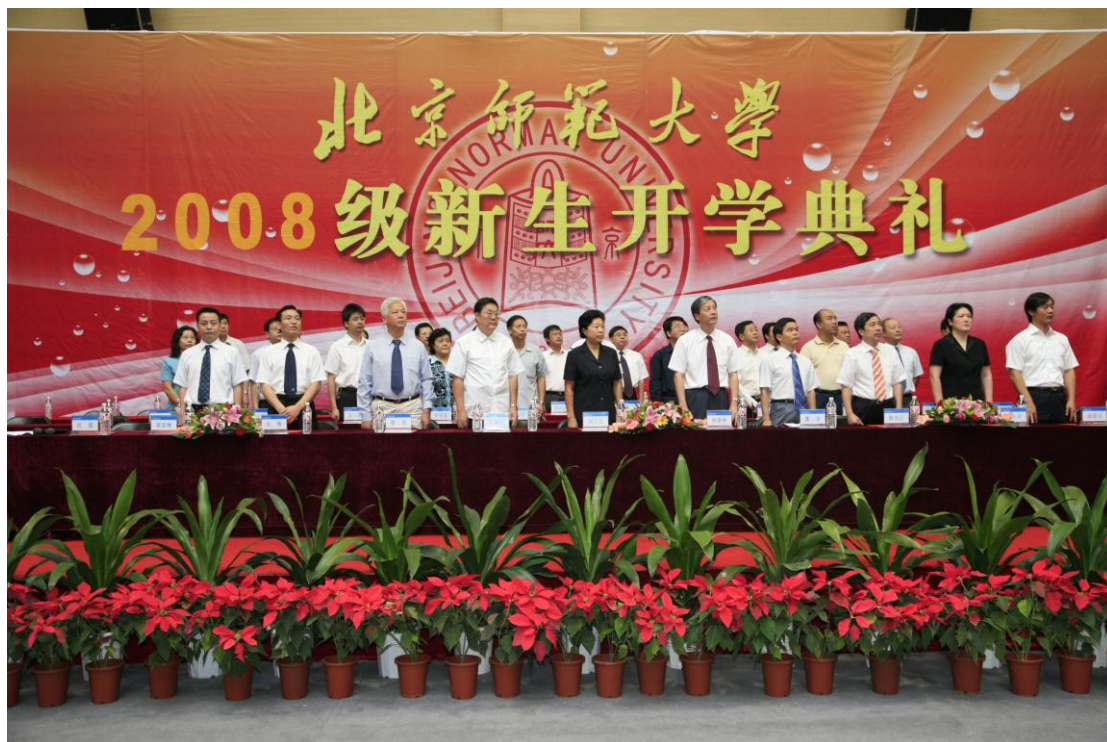
➤ 9月21日 2008级本科新生与研究生新生开学典礼举行