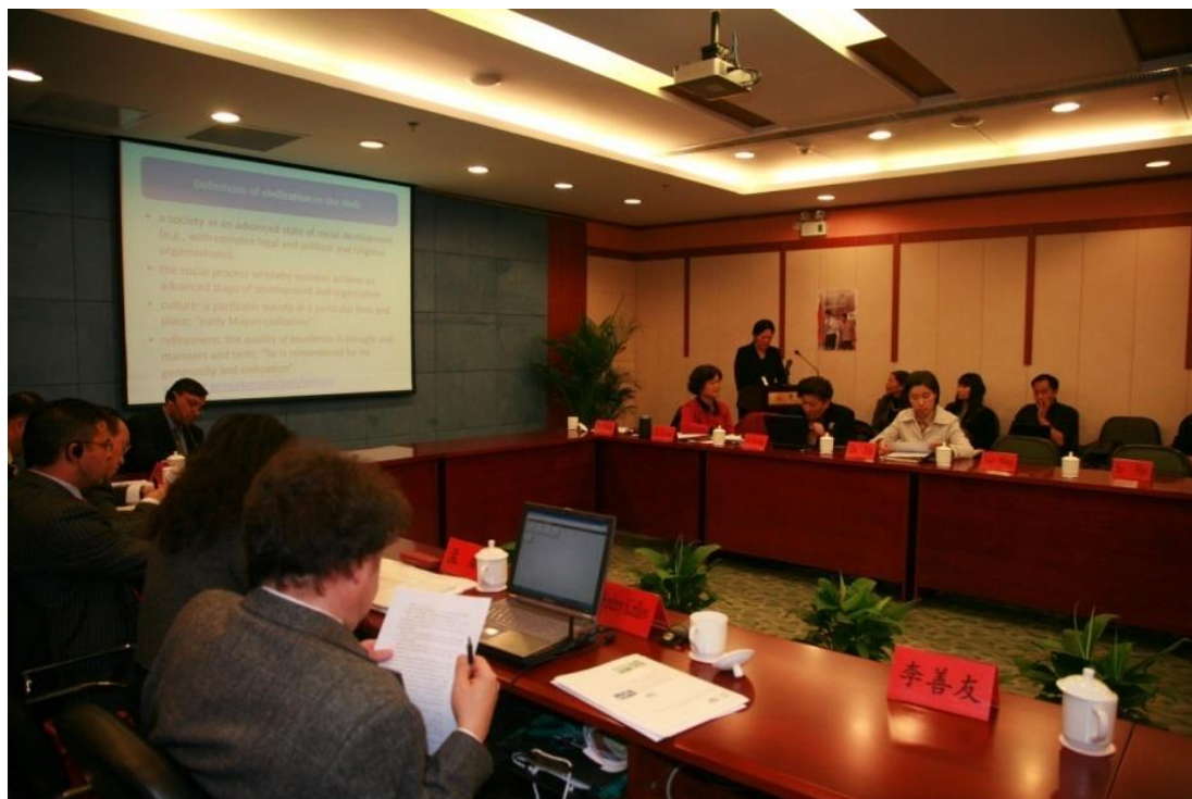
➤ 11月13日“媒体与信息传播技术在文明对话中的作用——高层论坛”国际研讨会在我校举行