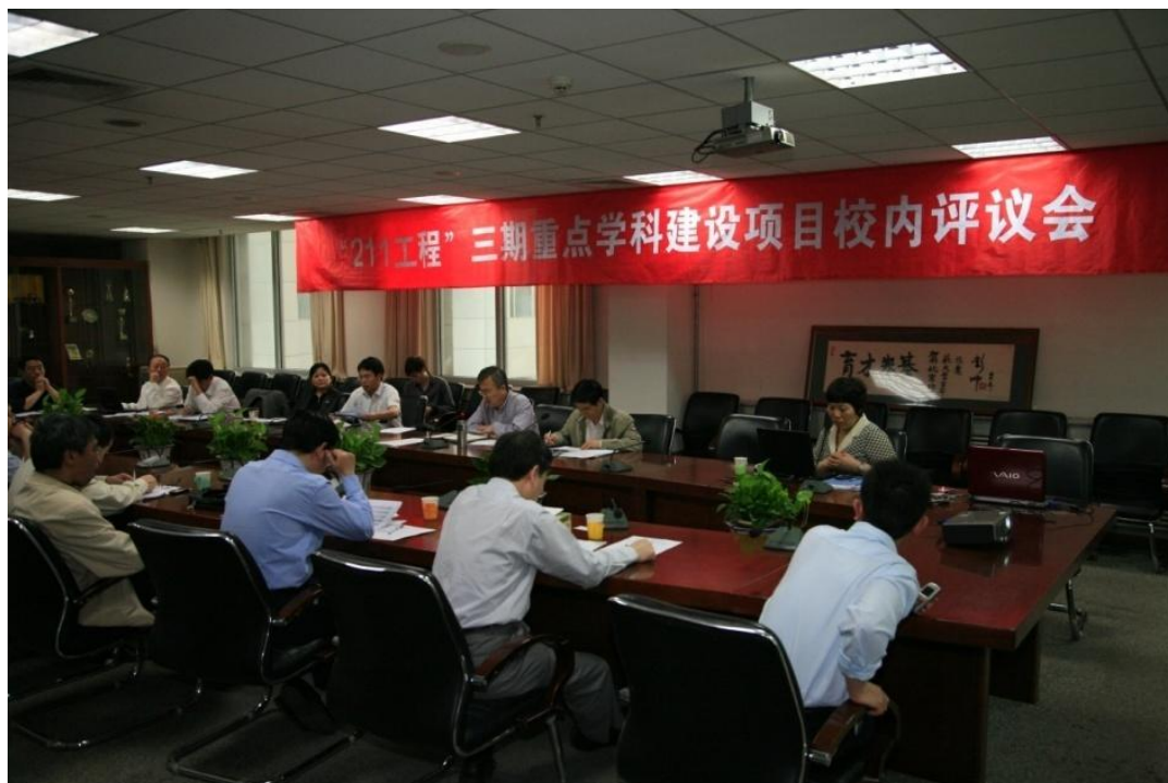
➤ 5月19日 我校召开“211工程”三期重点学科建设项目校内评议会。