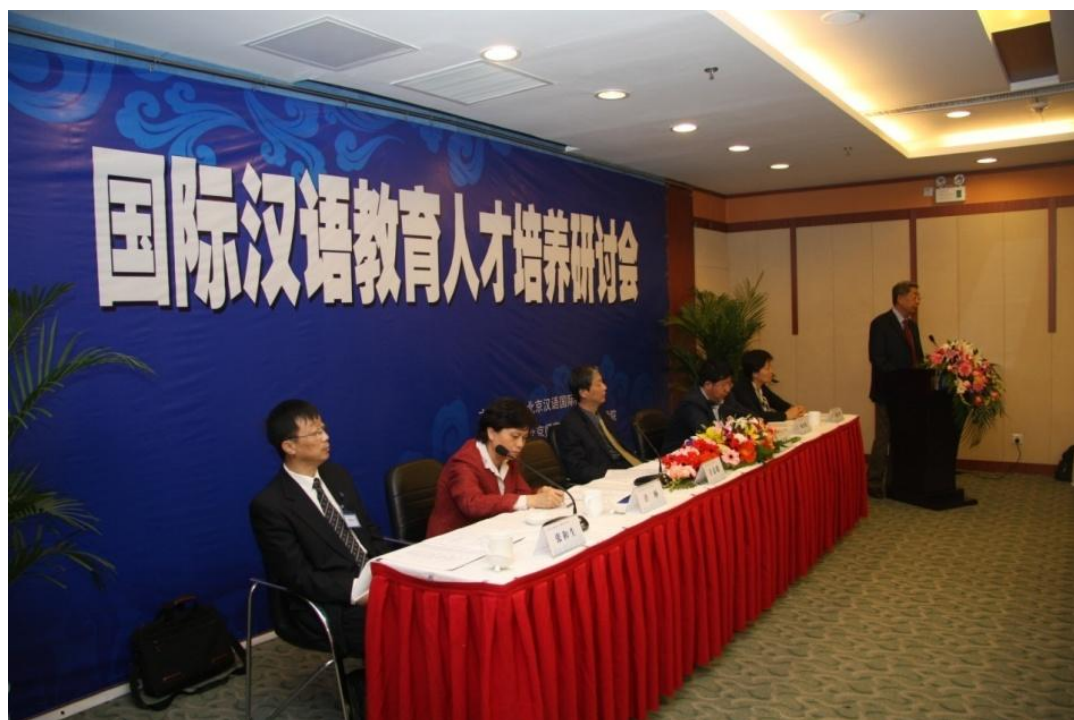
➤ 11月8日 首届“国际汉语教育人才培养研讨会”在我校召开