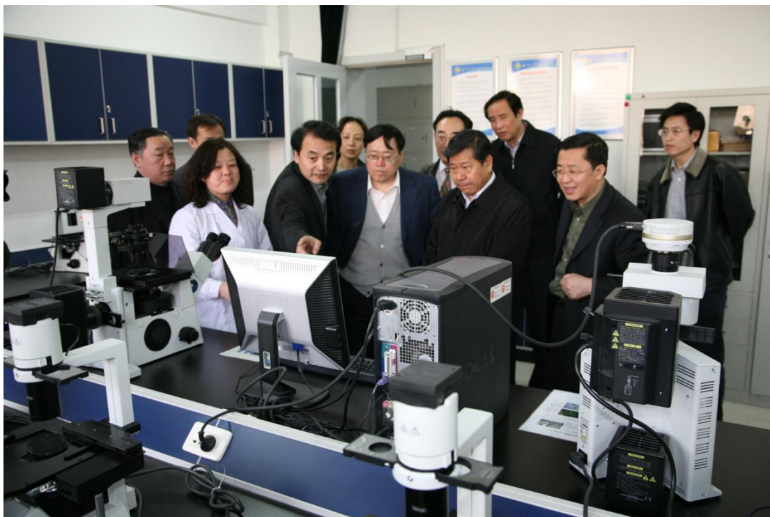
➤ 3月18日 北京市政协主席阳安江来我校调研