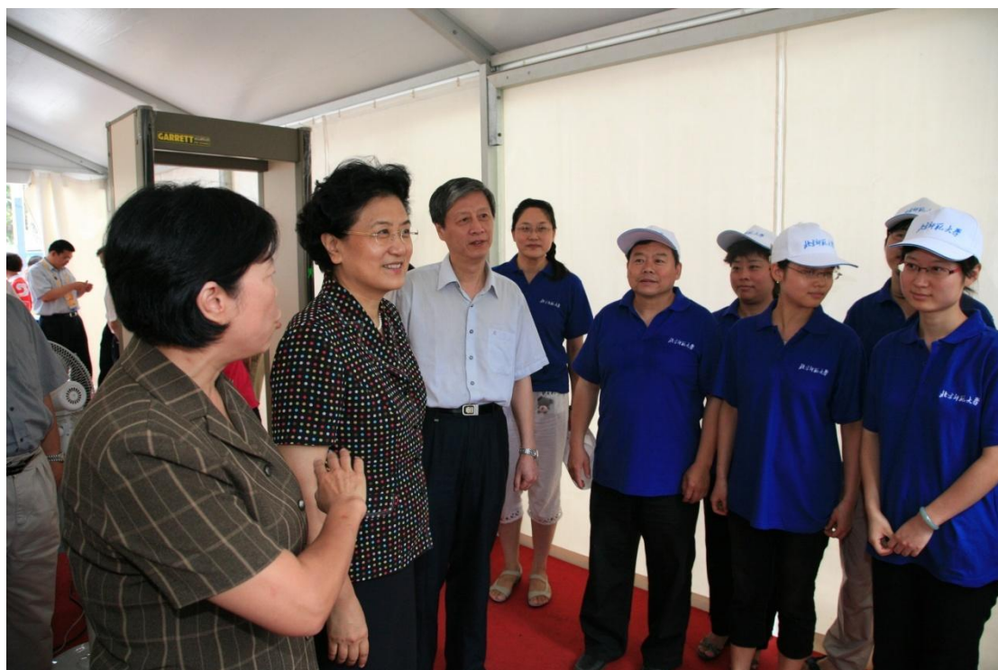
➤ 8月19日 国务委员刘延东视察我校奥运服务安保工作。