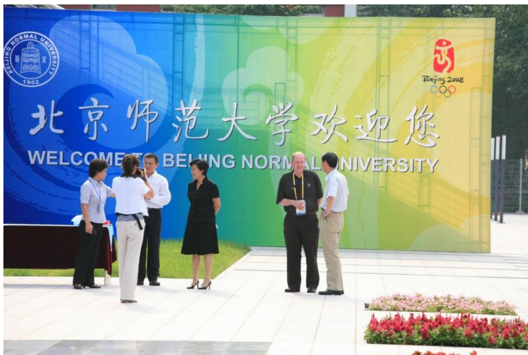
➤ 8月12日 美国前总统乔治·布什一行来访，看望在我校训练的美国运动员。党委书记刘川生、校长钟秉林会见了乔治·布什一行