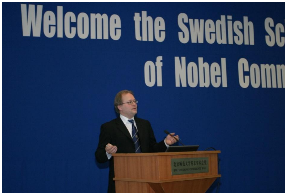
➤ 1月8日，诺贝尔奖评委会访问我校，图为诺奖评委为学生做报告。