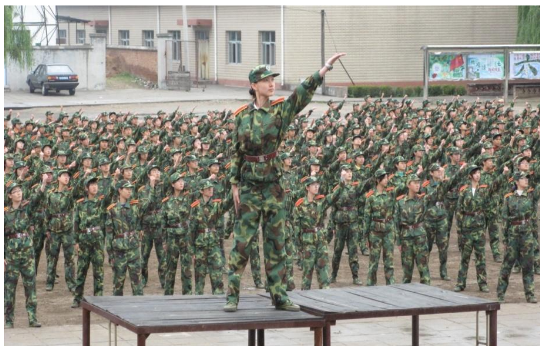
➤ 10月5日 我校2008级本科生军训结业典礼在北京市怀柔军训基地举行。图为同学们在进行汇报表演