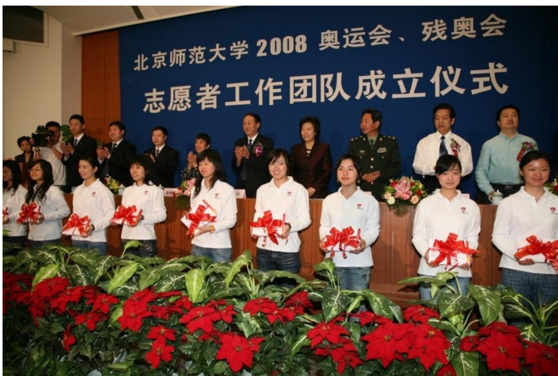
➤ 5月10日 我校奥运会、残奥会志愿者团队成立仪式隆重举行，全国首批以全国道德模范命名的志愿者先锋中队宣告成立