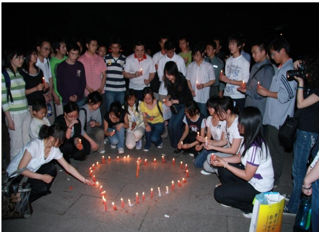
➤ 5月19日 我校学生自发为汶川地震灾区举办致哀活动