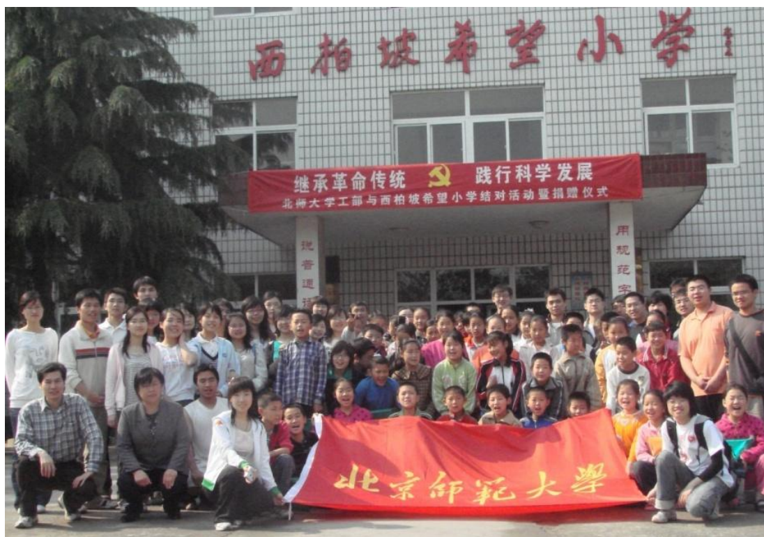
➤ 5月18日 我校在西柏坡举行“继承革命传统 践行科学发展”活动