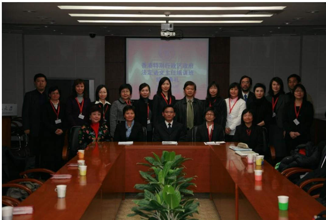
➤ 11月7日，我校承办的第九届香港政府法定语文主任培训班结业