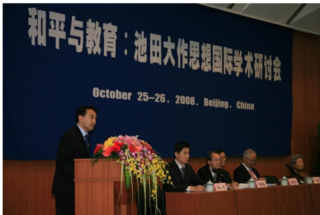
➤ 10月25日 我校与日本创价大学合办池田大作“和平与教育”思想国际研讨会