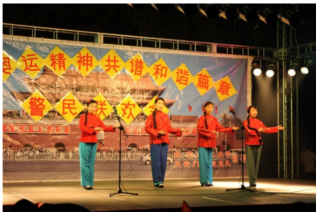
➤ 10月20日 我校与国旗护卫队举行共建活动