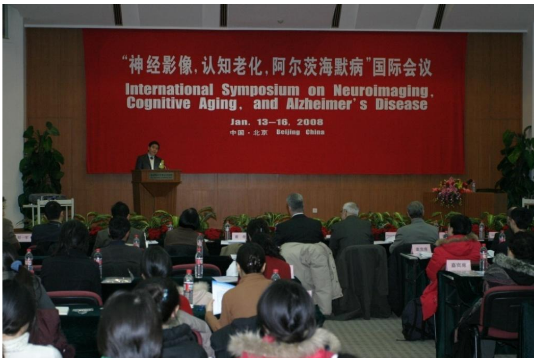
➤ 1月14日 “神经影像, 认知老化, 阿尔茨海默病”国际会议在我校召开