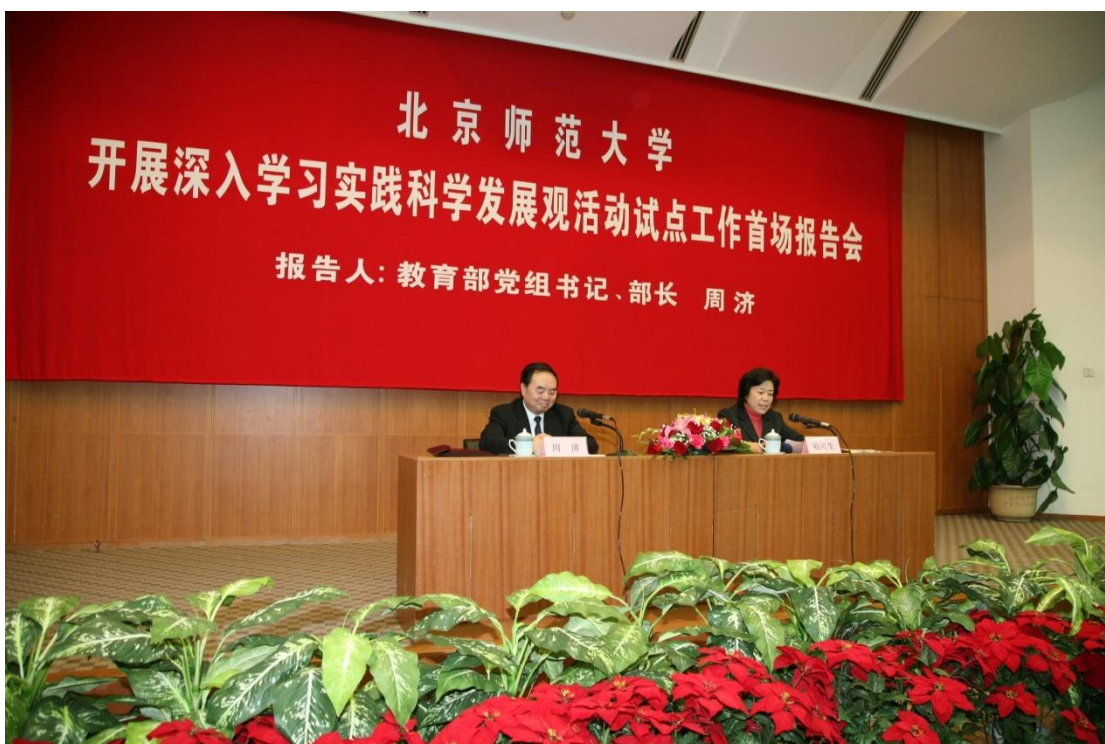
➤ 4月9日 教育部长周济来校做学习实践科学发展观试点工作报告